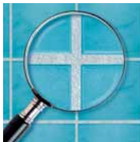
Spárovací hmota Ceresit s recepturou MicroProtect