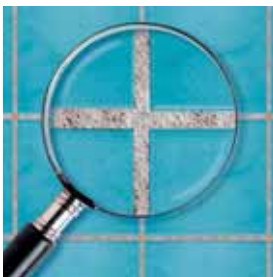
Běžná spárovací hmota

Spáry zůstanou čisté a krásné na opravdu dlouhou dobu!